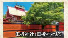
車折神社(車折神社駅)

「清めの社」 悪運の浄化や厄災削除のご神力が充実。 携帯の待受画像にすると運氣上昇。