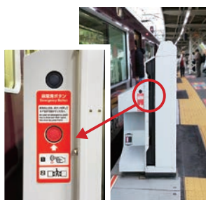
ホームドア非常用ボタン

万が一、お客様がホームドアと車両の間に取り残されるなどの状況となった場合、非常用ボタンを押下すると、ホームドアを手で開けることができます。