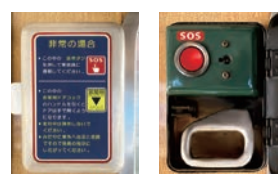
通話ができない機種