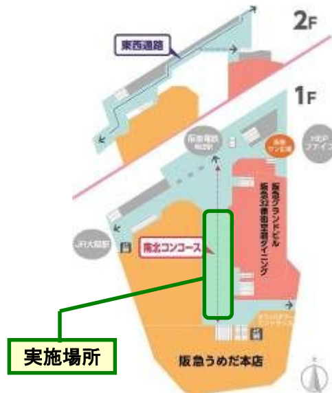
「フローティング・アーチ・クリスマス2014」開催場所