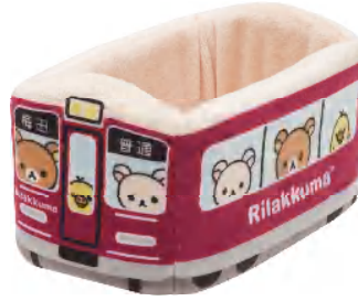
「マルチボックス」 1,296円