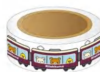
「マスキングテープ」