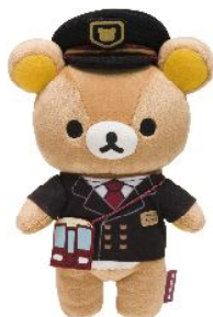
「ぬいぐるみ」 駅長リラックマ