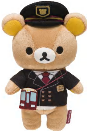
「ぬいぐるみ」駅長リラックマ 2,052円