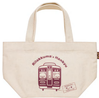
「ミニトートバッグ」 1,512円