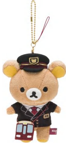
「ぶらさげぬいぐるみ」 1,404円