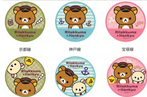
ヘッドマークデザイン（イメージ）