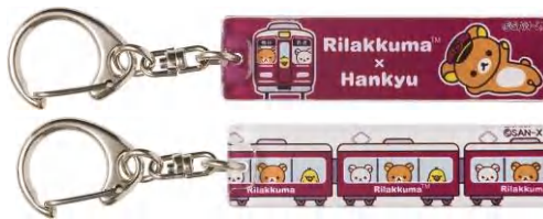
「アクリルキーホルダー」(2種) 各540円