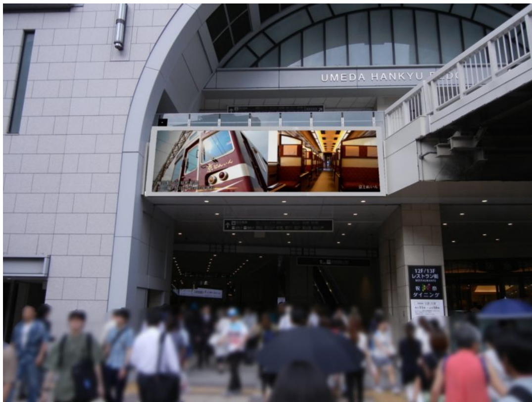
阪急デジタルサイネージ 「阪急梅田エントランスビジョン」 イメージパース

阪急電鉄では、JR 大阪駅方面から HEP ファイブ・HEP ナビオ方面を結ぶ「東西コンコース」の入口にあたる梅田阪急ビルの1階西側外壁に、阪急デジタルサイネージ「阪急梅田エントランスビジョン」を新設し、12月5日（月）から放映を開始します。