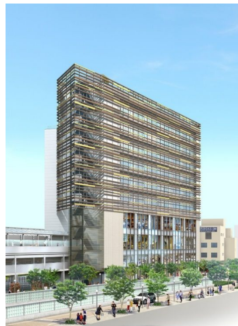
ビル外観のイメージパース (阪急西宮ガーデンズ方面より望む)