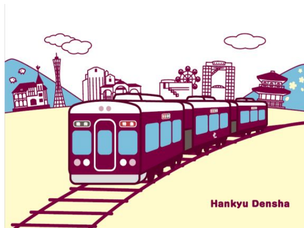
「Hankyu Densha」シリーズコンセプトデザイン

2016年9月から発売している阪急電車グッズ「Hankyu Densha」シリーズは、阪急電車の車体色として親しまれている“マルーンカラー”を基調にした柔らかくポップなイラストで仕上げ、阪急沿線各地の風景イメージを用いたオリジナルグッズです。「アズナス」や「アズナスエクスプレス」、「カラーフィールド」などで発売しています。