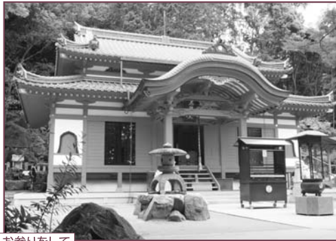
お参りをして ちょっと休憩

西国三十三ヶ所の観音様が、 星に乗って中山寺の本堂に 集まると伝えられるこの日 にお参りをすると、4万6千日も お参りしたのと同じ功德があると 伝えられています。午後9時からは、 境内で勇壮な「梵天お練り」も行われます。