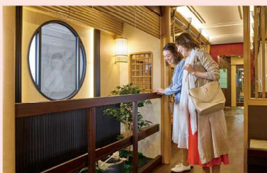
2号車と5号車には坪庭が