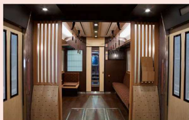
京町家をイメージした格子窓も