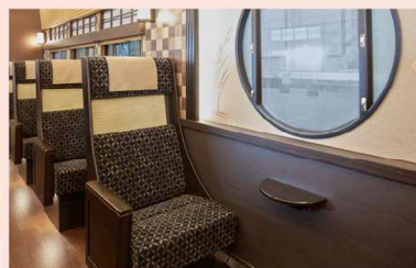
電車には珍しい円窓も登場