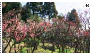
② 岡本梅林公園 36種類約200本、見頃は2月中旬~3月中旬頃。