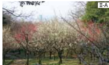
③ 保久良梅林 約250本、見頃は3月下旬。