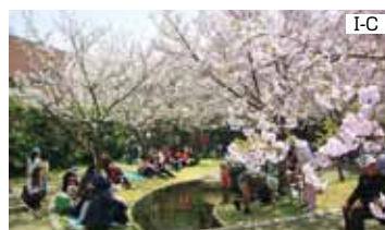
① 岡本南公園 別名桜守公園。10種約30本の桜が楽しめる。