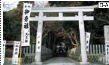
④ 保久良神社 古代よりの巨石信仰の聖地。