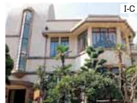
① こうべ甲南武庫の郷 国登録有形文化財であり、奈良漬の老舗、甲南漬の本店と資料展示をしています。(資料館) 10:00~17:00 (ショップ) 9:30~18:30 ☎078-842-2508 / 年末年始休