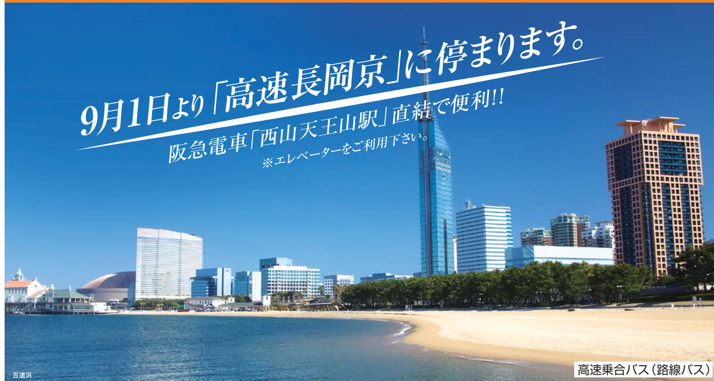
高速乗合バス(路線バス)

9月1日より「高速長岡京」に停まります。 阪急電車「西山天王山駅」直結で便利!! ※エレベーターをご利用下さい。