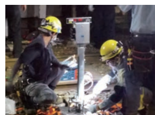
地上設備被害・復旧状況