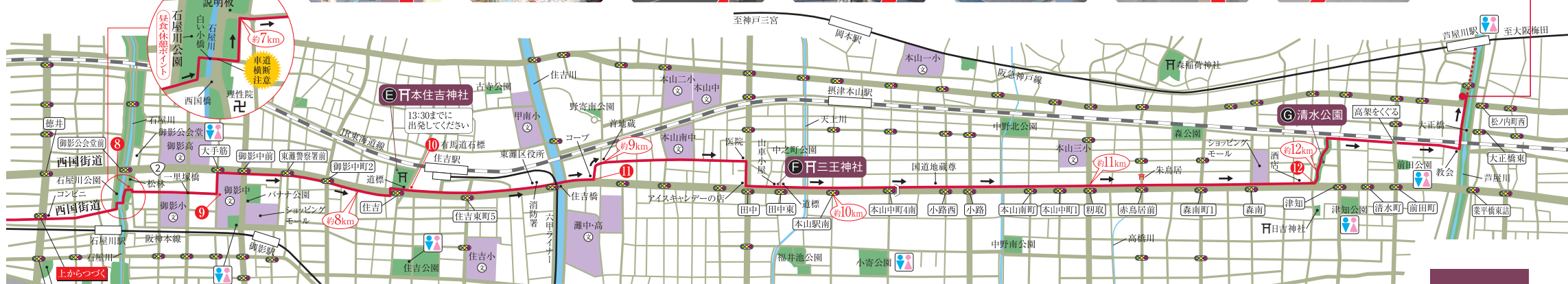
8 徳川道起点説明板を右折