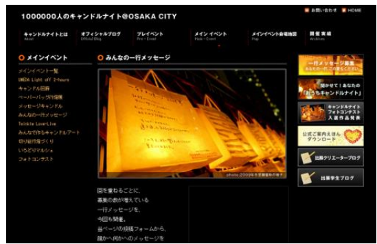
◇WEBサイト 2014年6月応募総数: 1003件

◆掲出場所 西梅田ナイト:ハービスPLAZA プロムナード 茶屋町ナイト:アプローズタワー東側 植栽周り