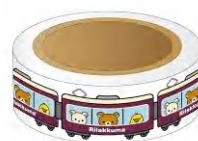
「マスキングテープ」