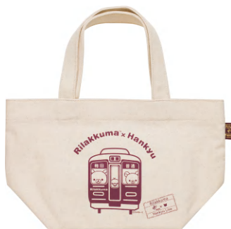
「ミニトートバッグ」