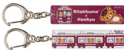
「アクリルキーホルダー」(2種)