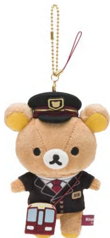
「ぶらさげぬいぐるみ」