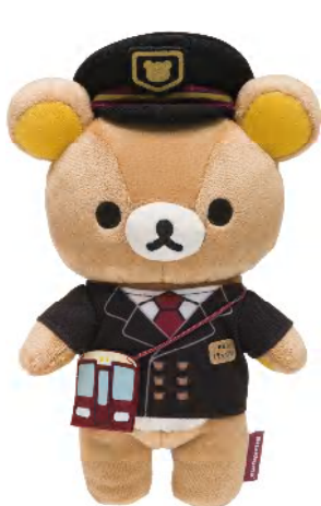
「ぬいぐるみ」駅長リラックマ