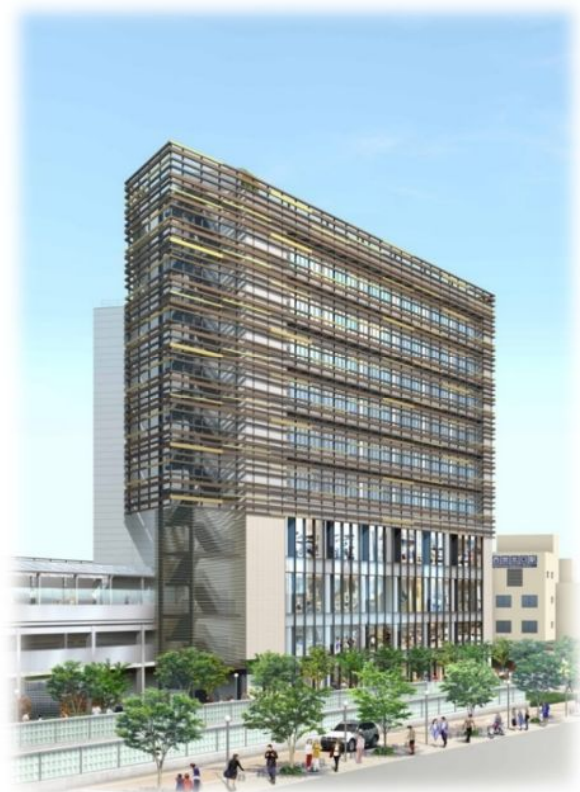
外観イメージパース (阪急西宮ガーデンズ方面から望む)