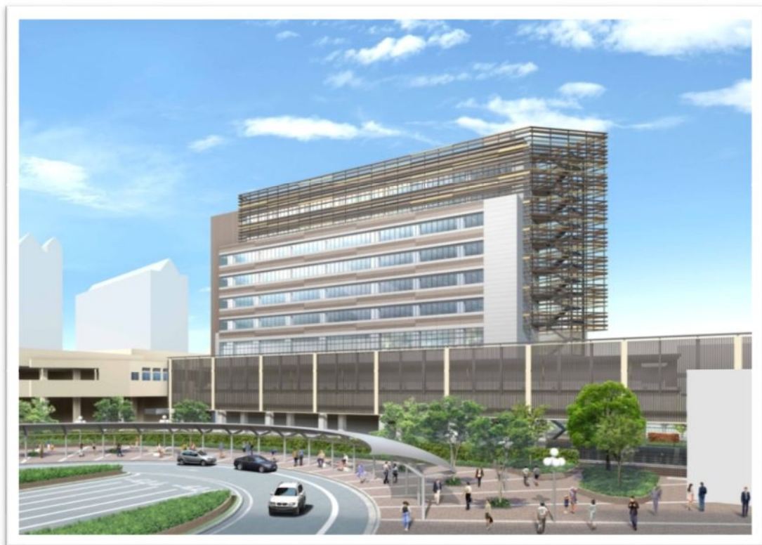
外観イメージパース (西宮北口駅南バスロータリーから望む) ※西宮北口阪急ビルの手前は今津行きホーム