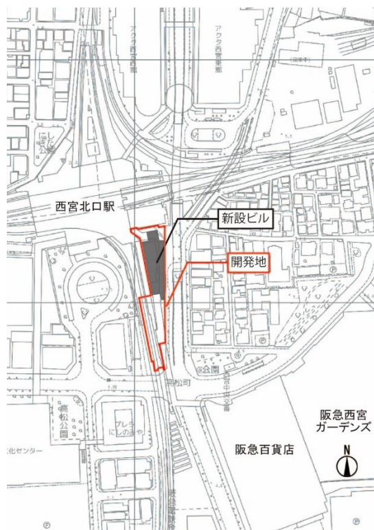
「西宮北口阪急ビル」計画位置図

今後はこの開発を通じて、駅周辺のさらなる活性化を図り、子育て世代をはじめとする幅広い世代の皆様へ、この街に末永く住み続けたいと思っただけの沿線・まちづくりに取り組んでまいります。