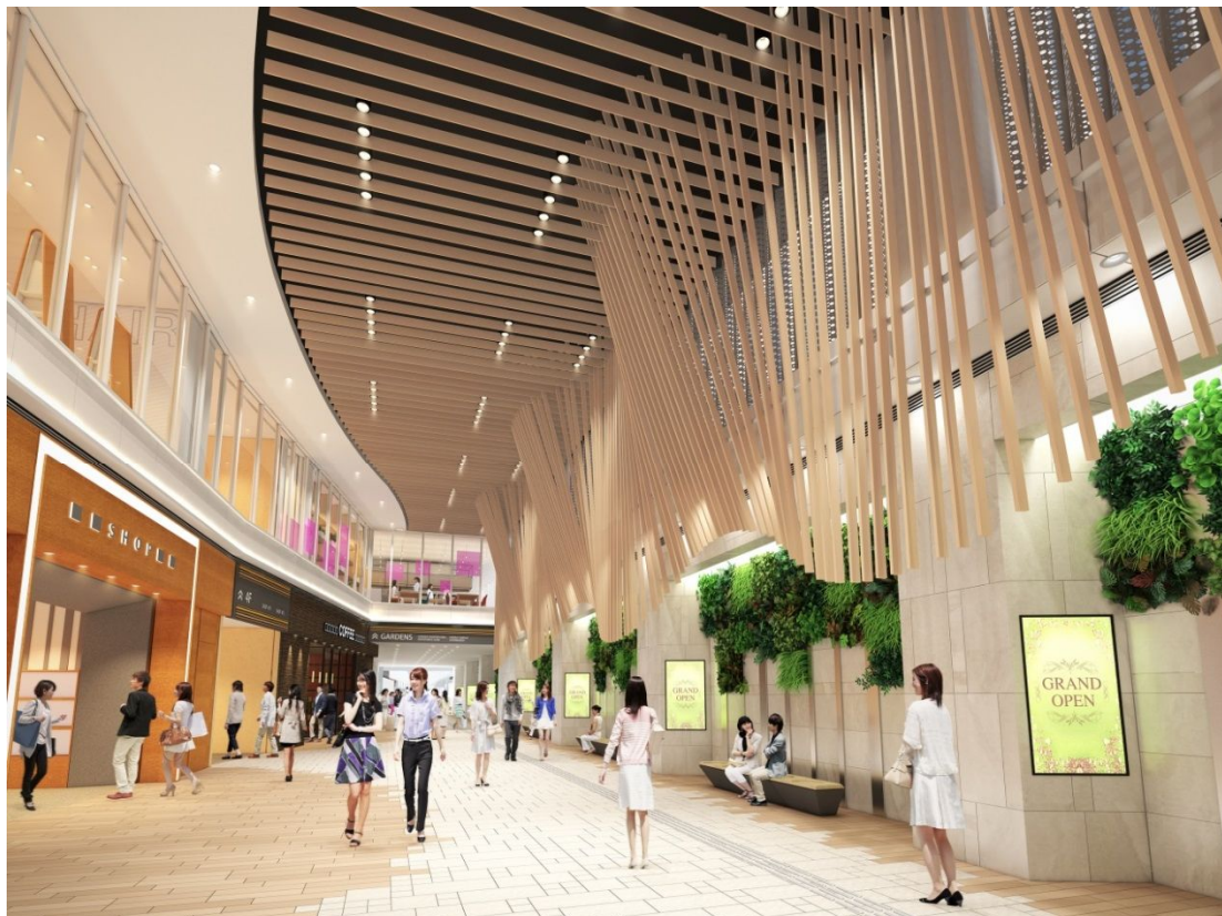
西宮北口阪急ビル3階 コンコース吹き抜け部 イメージパース