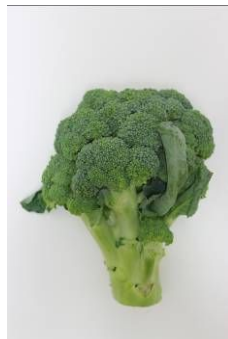
大山ブロッコリー（鳥取県）