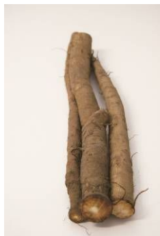
村山早生ごぼう（長野県）