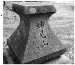
江戸時代の妙見宮灯籠が並ぶ、文政・嘉永年間のもの

長尾街道(妙見街道)と宝塔の説明板 (宝塔は天明大(1786)に大坂神力講世話人によって建文されました)