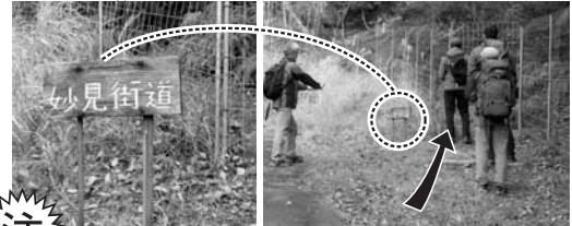
右側に「妙見街道」の道標 柵のトビラから出る