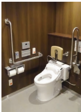
多機能トイレの内観