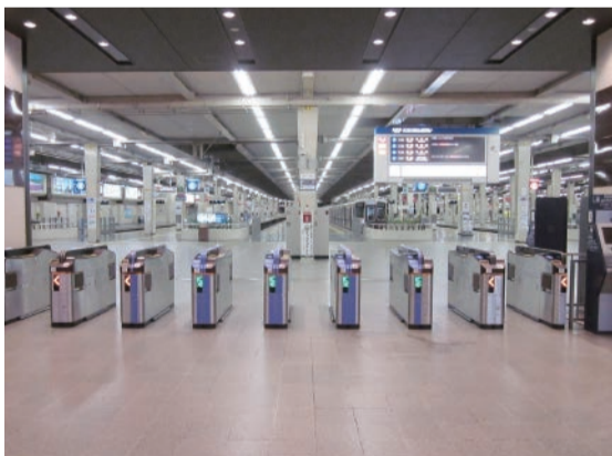
(大阪梅田駅3階改札口)

更新に伴い、一部の改札機をICカード専用機に変更いたします。この機会に便利なICカードを是非ご利用ください。