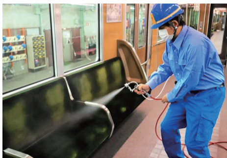
抗ウイルス・抗菌加工の様子