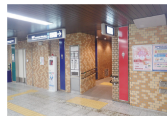
2階構内コンコーストイレ外観

本工事では、お客様の多様なニーズにお応えするため、オストメイトや車椅子をご使用のお客様も利用可能な簡易多機能ブースを男子トイレ、女子トイレにそれぞれ設置しています。その他、洋式ブースではゆとりある空間の確保、開閉が容易な引き戸の採用、カウンターと一体型のスリムかつコーナースペースの有効利用が図れる手洗い器の採用、全ての大便器への温水洗浄便座の設置などを実施しています。また、臭気対策として換気風量の増加や臭い溜まりを少なくする工夫を凝らしており、お客様に気持ち良くお使い頂けるトイレとなりました。なお、今回のリニューアルに併せて男女共用多機能トイレの新設も行ってまいります。ぜひご利用下さい。