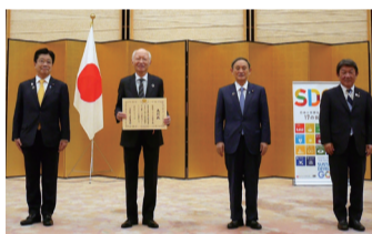
首相官邸大ホールにて行われた表彰式の様子