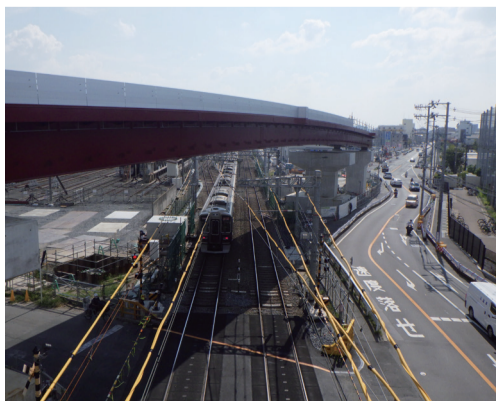
京都本線と都市計画道路十三高槻線との交差状況