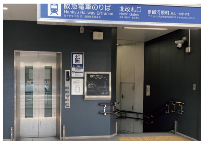
エレベーター(西院駅)

詳しくは▶ 阪急電鉄ホームページ https://www.hankyu.co.jp/topics/details/1425.html をご覧ください。