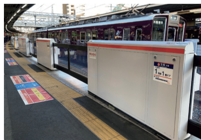
可動式ホーム柵(十三駅3号線ホーム)