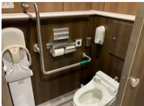
夙川駅 男子トイレ大便ブース