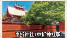
車折神社(車折神社駅)

★ 利益ポイント 「清めの社」 悪運の浄化や厄災削除のご神力が充実。携帯の待受画像にすると運氣上昇。