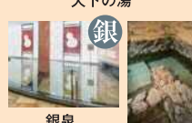
銀泉 かつろぎの湯