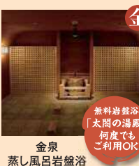
金泉 蒸し風呂岩盤浴