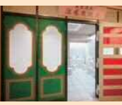
南蛮渡来涼感爽快健身房