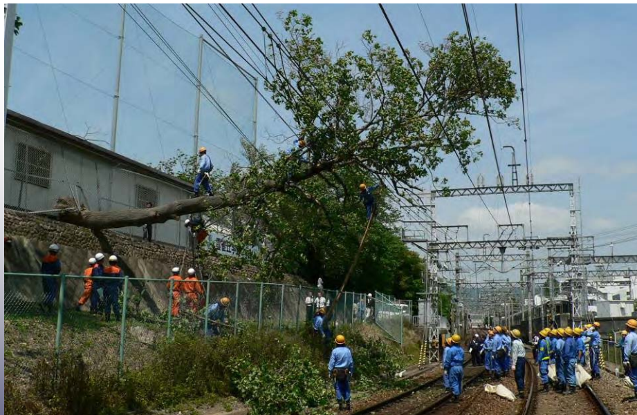
自然災害（倒木） 宝塚本線 雲雀丘花屋敷駅—山本駅間 2009年5月13日