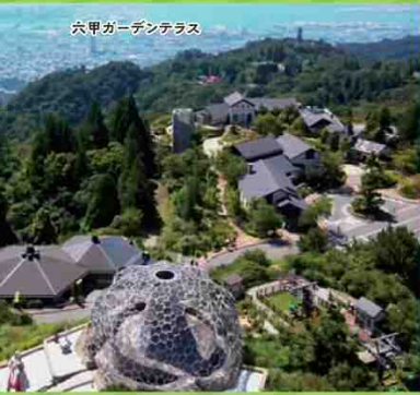
六甲ガーデンテラス

六甲有馬ロープウェイの当日の運行状況は携帯電話からも確認できます 詳しくは左記2次元バーコードを読み取ってアクセスしてください https://koberope.jp/rokko