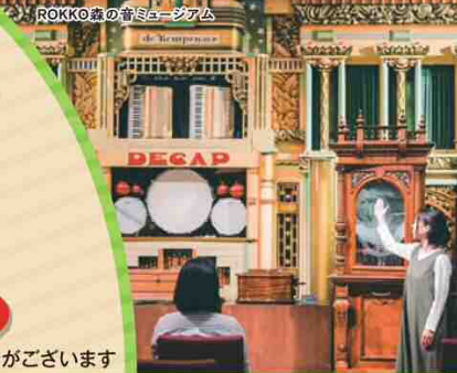
ROKKO 森のミュージアム

有馬温泉・六甲山を周遊できる乗車券に、 「金の湯」または「銀の湯」ご利用券と、 各施設がお得に楽しめる 「施設ご優待券」がセットになった乗車券。